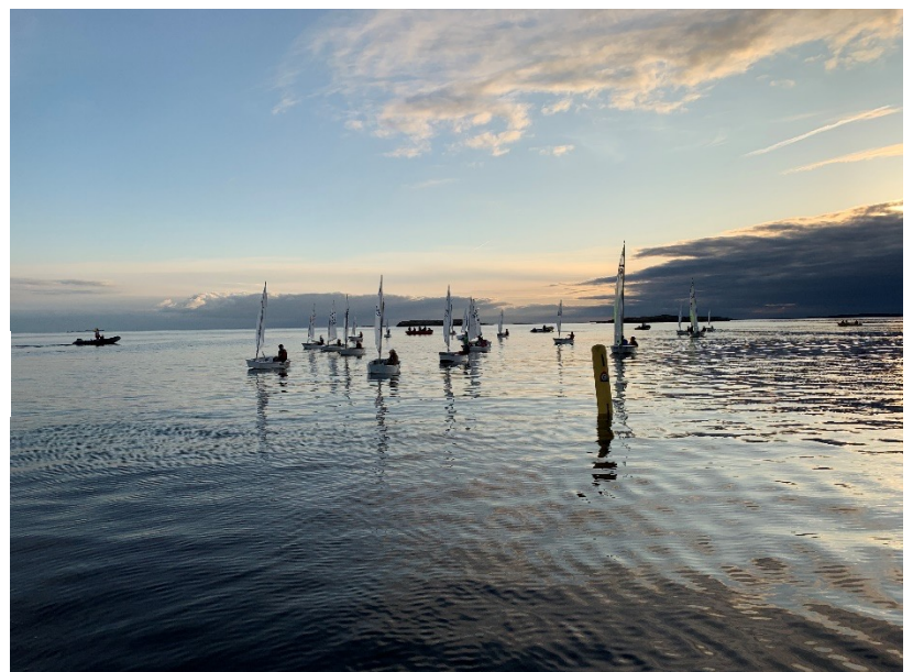
En stille dag på fjorden, høst 2019.