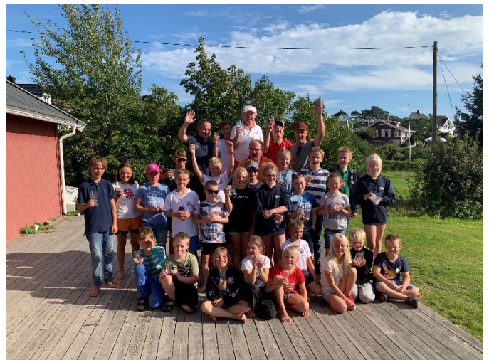
Premieutdeling Østfold Cup #3.