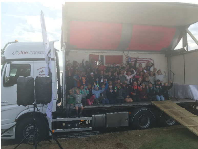
Premieutdeling NM (søndag).