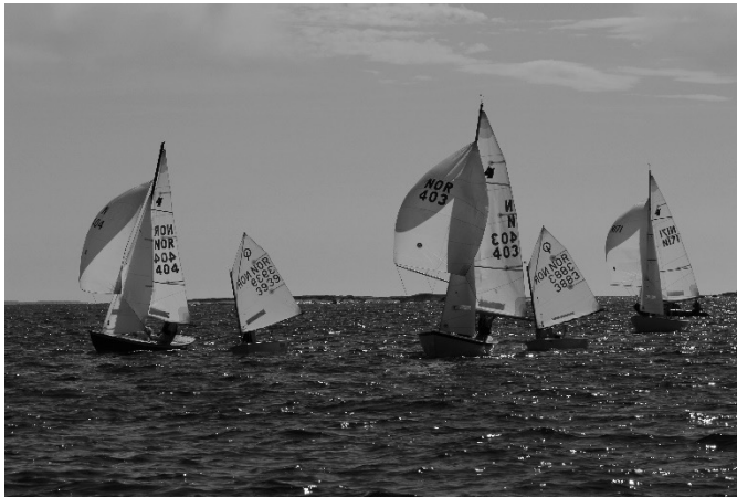
Østfold Cup #3. Killinger og Optimister på vei mot mål linjen.