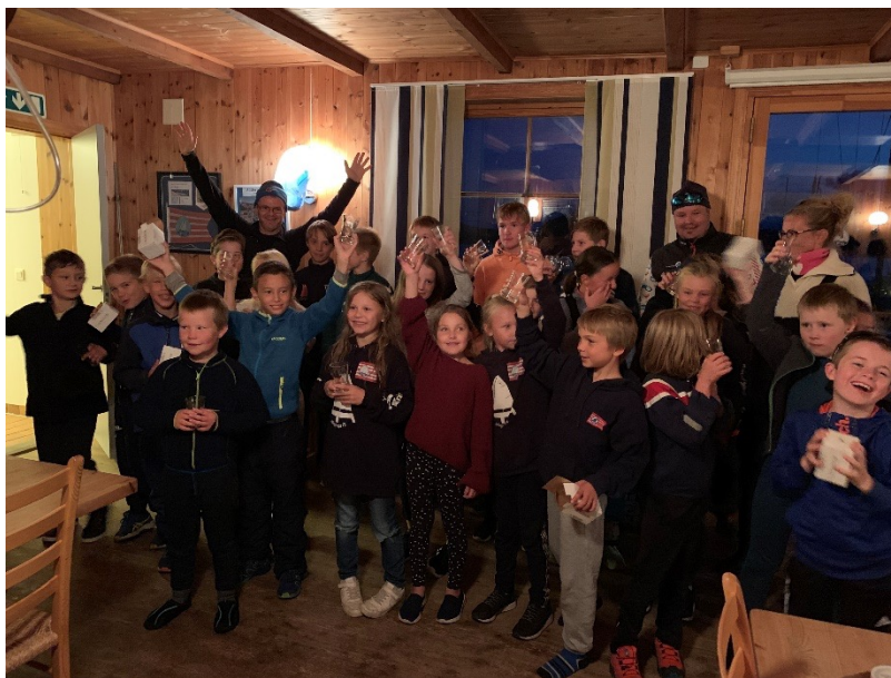
Jollegruppa. Siste trening før vinteren.